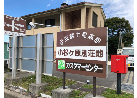
カスタマーセンター入り口