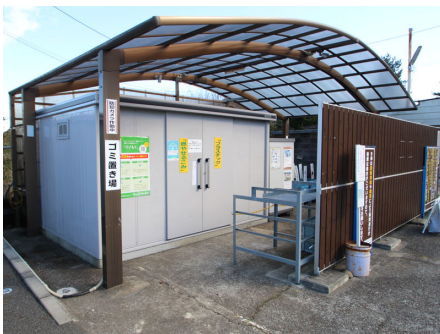
ゴミ置き場（カスタマーセンター横）