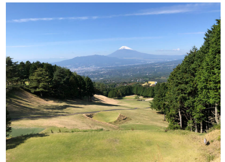
別荘地近くの富士箱根カントリークラブ