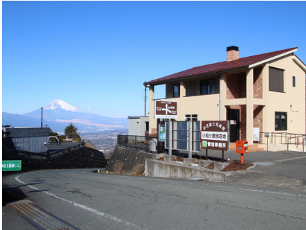
カスタマーセンター

裾野を長く引く霊峰富士を一望し、駿河湾・三島・沼津の町を眼下に見る小松ヶ原別荘地は、富士・箱根・伊豆国立公園のほぼ中央に位置するなだらかな標高550メートルの高原です。周囲は伊豆スカイラインなどのハイウェイが走り、伊豆・箱根を全てあなたのものにできる最高の立地。富士山一帯の街並みの眺望は絶景です。すぐ隣には富士箱根CCがあり、ゴルフ好きの方にはたまらない別荘地です。