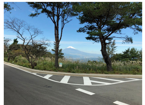
別荘地から富士山を望む