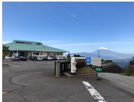
別荘地近くの富士箱根カントリークラブ