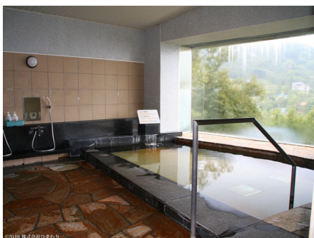
温泉大浴場【サウナ付き】