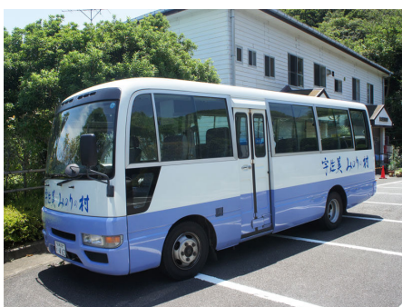
別荘地巡回無料バス