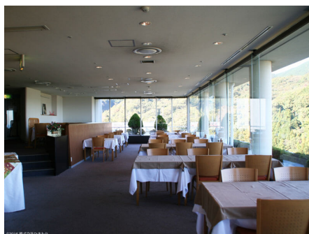
予約制 レストラン