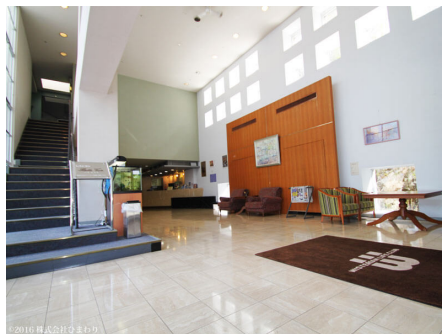
ホテル兼用ロビー