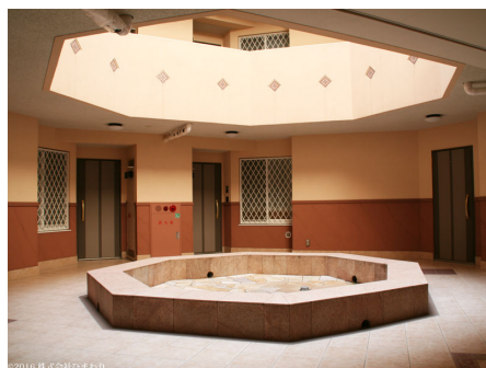
マンション中央の吹き抜け