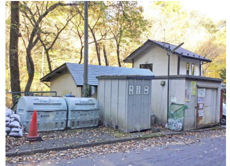
ゴミ置き場（管理事務所横）