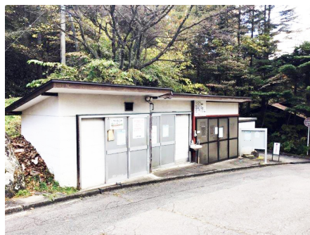
管理事務所前にあるゴミステーション