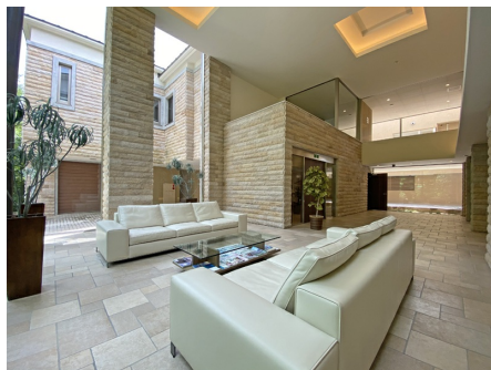
アリアヴィータ軽井沢 外観