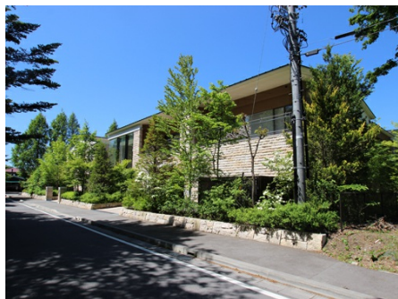
アリアヴィータ軽井沢 外観