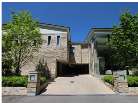
アリアヴィータ軽井沢 外観