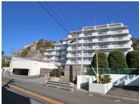
マンション外観 (正面)