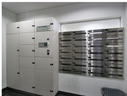
集合ポスト・宅配ボックス