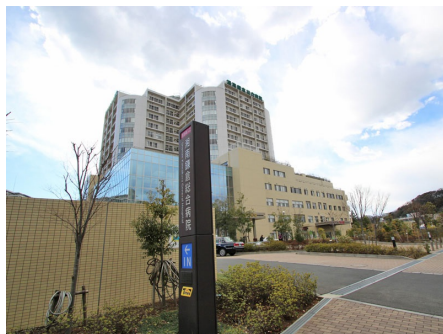
湘南鎌倉総合病院