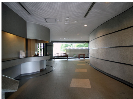
重厚感のあるロビー