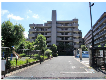
マンション出入口より