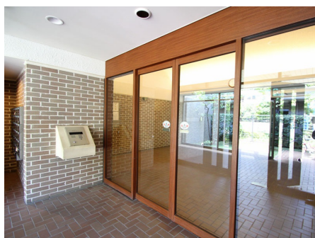
オートロック付き