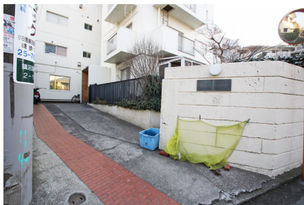
マンション出入口