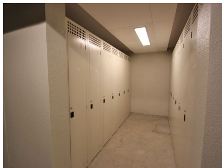
サーフボード置場