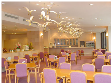
レストラン（通年営業）