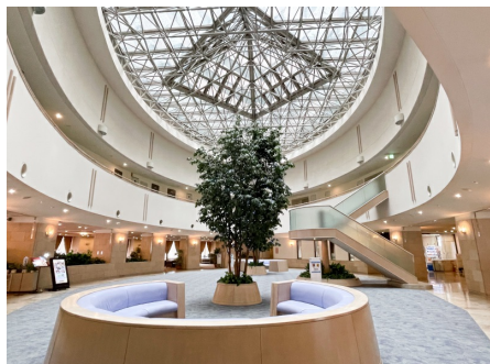
吹き抜けのロビー