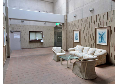
エントランスロビー