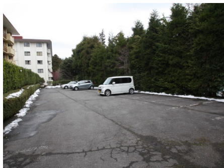
無料で使える屋外駐車場