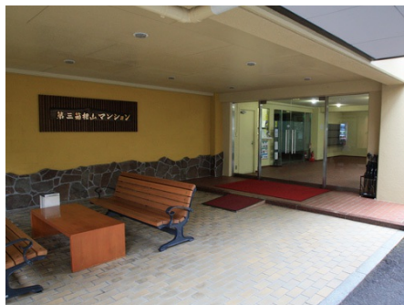
マンション入り口