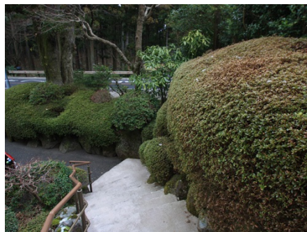
手入れの行き届いた庭木