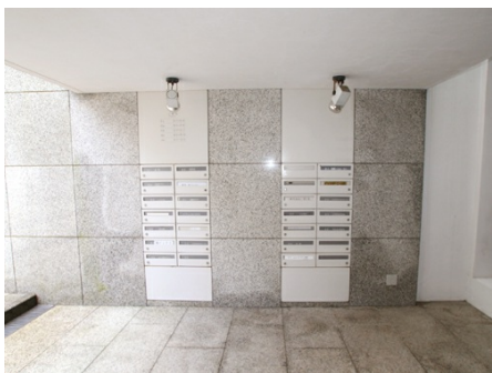
おしゃれな集合ポスト