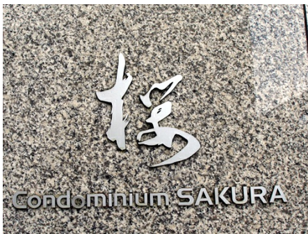
マンションエンブレム