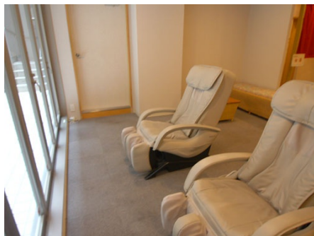
マッサージチェア