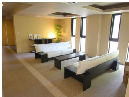
エントランスロビー