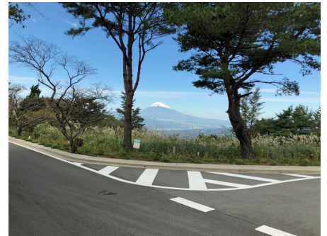
別荘地から富士山を望む