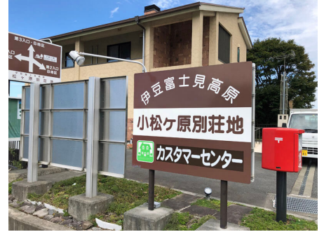
カスタマーセンター入り口