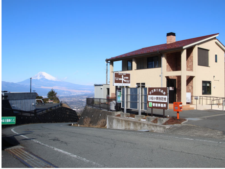
カスタマーセンター

裾野を長く引く霊峰富士を一望し、駿河湾・三島・沼津の町を眼下に見る小松ヶ原別荘地は、富士・箱根・伊豆国立公園のほぼ中央に位置するなだらかな標高550メートルの高原です。周囲は伊豆スカイラインなどのハイウェイが走り、伊豆・箱根を全てあなたのものにできる最高の立地。富士山一帯の街並みの眺望は絶景です。すぐ隣には富士箱根CCがあり、ゴルフ好きの方にはたまらない別荘地です。