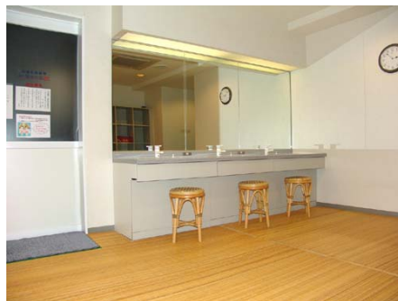
大浴場脱衣所 (女湯)