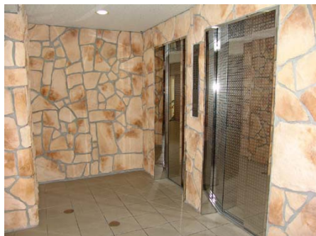
エレベーターホール