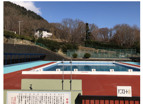
別荘地内施設 屋外プール