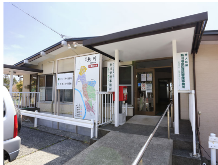
カスタマーセンター入口