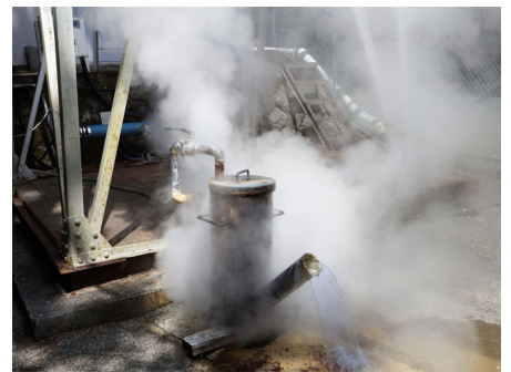
熱川温泉 引き込み可