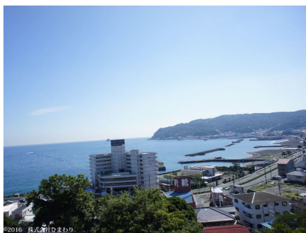
マンションからの眺望