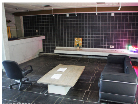
鉄平石が敷き詰められたロビー