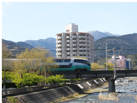
白田川と電車とロワジール熱川南