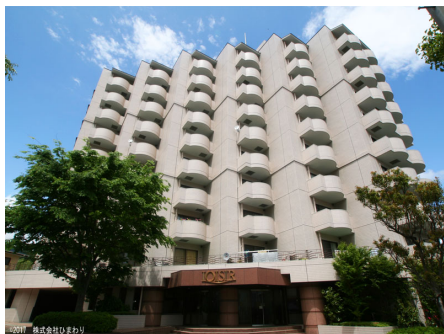
ロワジール熱川南外観