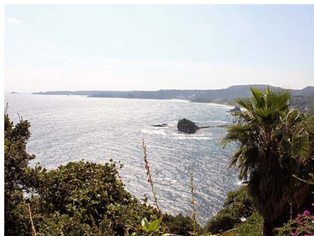
尾ヶ崎ウイングまで7.3キロ 車で13分