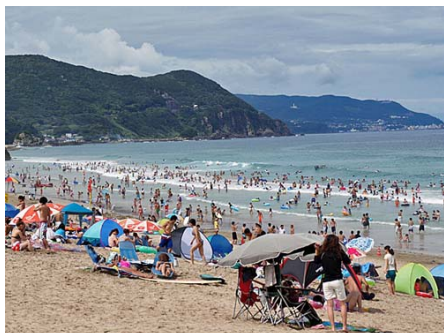
白浜まで3.5キロ 車で約7分