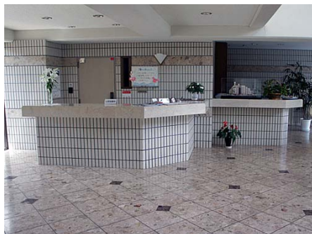
ホテルの様なフロントロビー