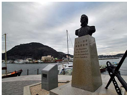
下田港まで2キロ 車で約5分