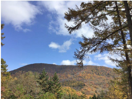
別荘地内からの眺望

旧軽井沢の愛宕神社北東部の別荘地。愛宕山の東側斜面となる為、傾斜の区画が多いです。冬季（12月～3月頃）の水道供給は停止され、期間中の道路に除雪は入りませんので、注意が必要です。