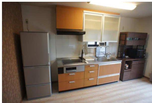
【キッチンには冷蔵庫と食器棚付】