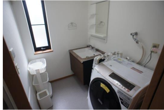
【洗濯乾燥機も完備】