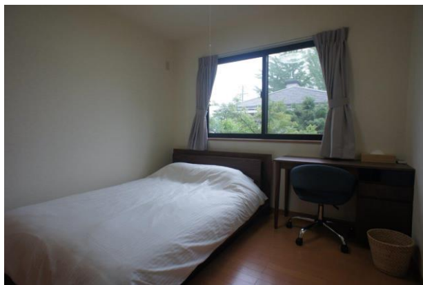
【洋室②には書斎もあります】