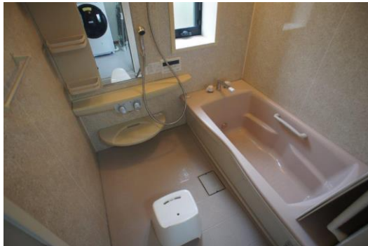
【▲浴室 玄関ホールと下駄箱▼】