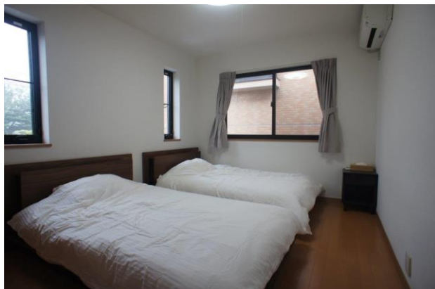
【洋室①にもセミダブルベッド2台】