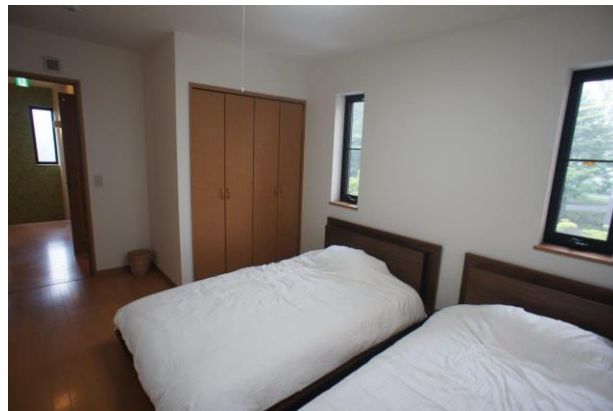
【洋室①にもクローゼットがあります】