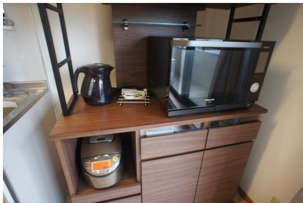
【電子レンジ・炊飯器・電気ケトル付】