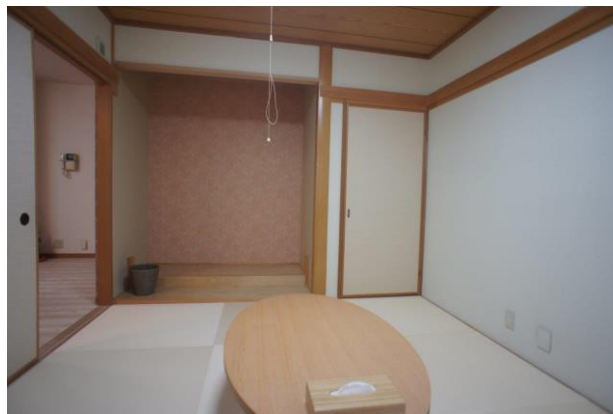
【LDKの横には和室もあります】