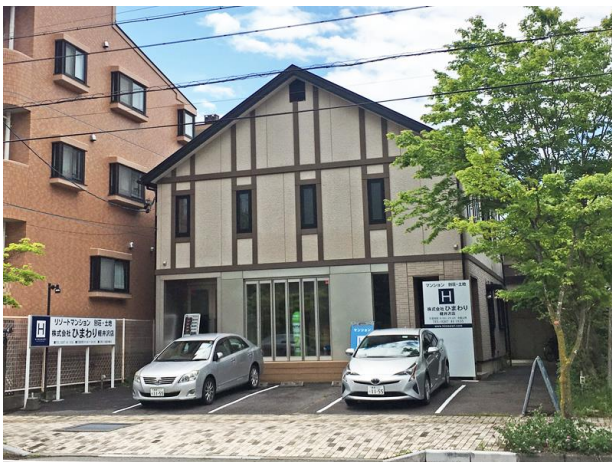
【こちらの2階部分が賃借対象部分です】

JR軽井沢駅徒歩約4分と立地に恵まれたシーズン賃貸戸建の登場です。軽井沢駅徒歩圏の立地ながら国道18号線を挟んで自然豊かな矢ヶ崎公園が目前に広がります。軽井沢大賀ホールへも徒歩約5分とアクセス良好です。ファミリーマートとスーパーヤオトクへも徒歩約5分と軽井沢での生活を存分にお楽しみ頂けるかと思ます。駐車場も1台分確保していますので、軽井沢を拠点に周辺地域の散策もお楽しみ頂けるかと思ます。