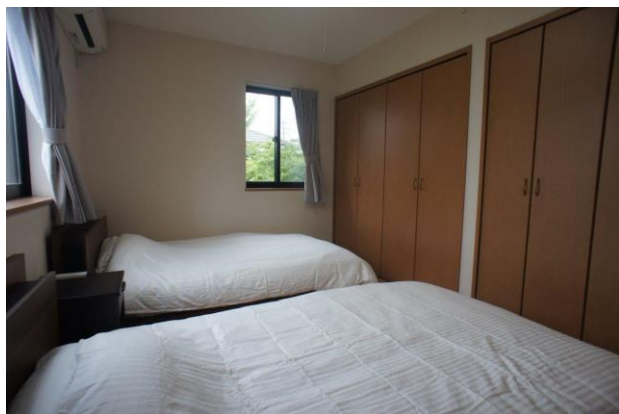
【洋室③にはクローゼットが2箇所】