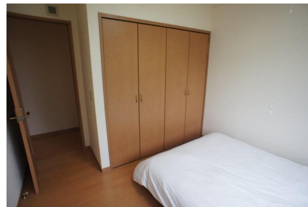
【洋室②もクローゼット付】