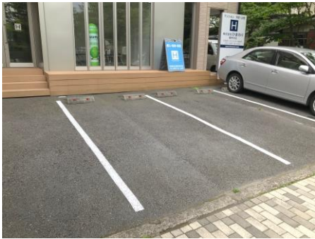
【借主様専用駐車場をご用意しております】

JR軽井沢駅徒歩約4分と立地に恵まれたシーズン賃貸戸建の登場です。軽井沢駅徒歩圏の立地ながら国道18号線を挟んで自然豊かな矢ヶ崎公園が目前に広がります。軽井沢大賀ホールへも徒歩約5分とアクセス良好です。ファミリーマートとスーパーヤオトクへも徒歩約5分と軽井沢での生活を存分にお楽しみ頂けるかと思ます。駐車場も1台分確保していますので、軽井沢を拠点に周辺地域の散策もお楽しみ頂けるかと思ます。