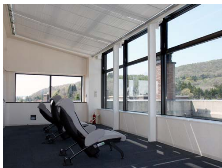
ピュールラウンジ