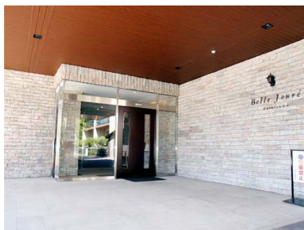
メインエントランス