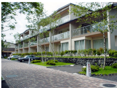
ベルジュール軽井沢 外観