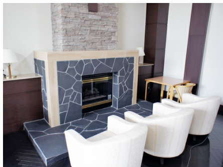
暖炉を囲んでおくつろぎ下さい