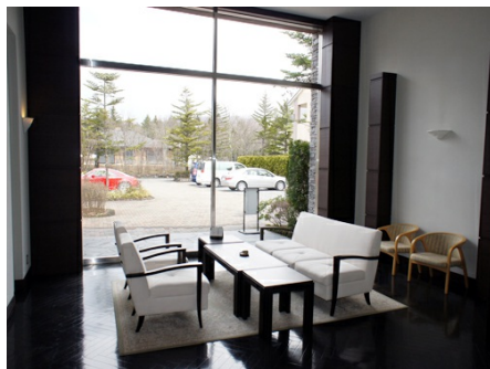
ラウンジでゆっくりと