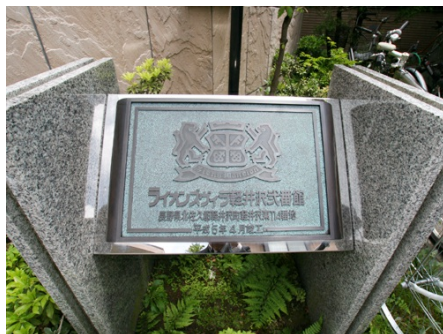
オーナメントがお出迎え