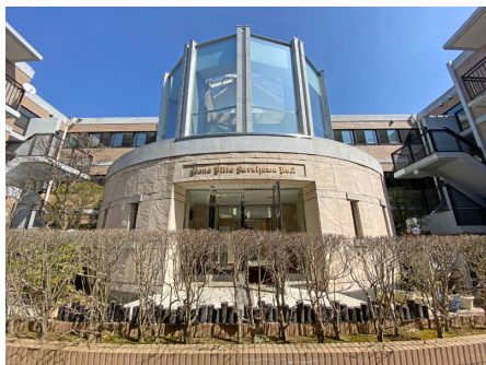
エントランス外観