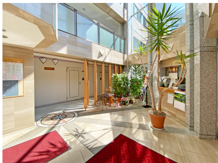
明るいエントランス内部