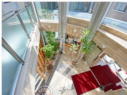
ロビーは吹き抜けです