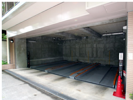
(有料) 屋内駐車場・重量制限あり