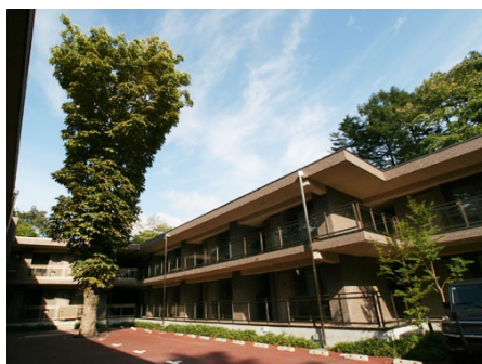
旧軽井沢ヴェルミール外観