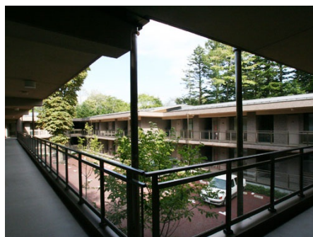
開放感溢れる中庭