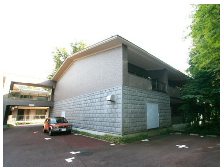
旧軽井沢ヴェルミール外観