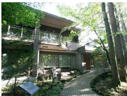
旧軽井沢ヴェルミール外観