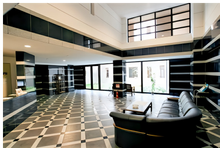
エントランスホール