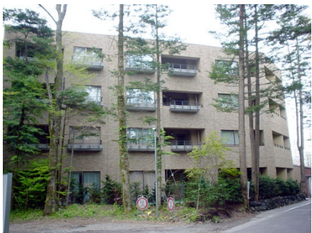
旧軽井沢三笠ハウス 外観