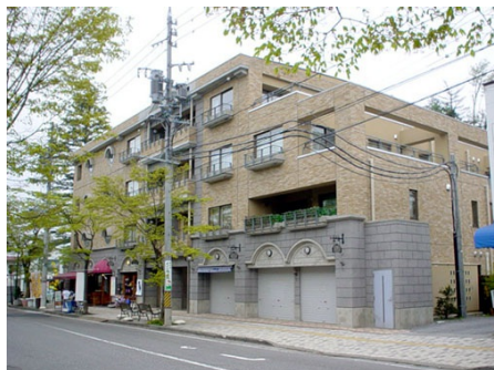
旧軽井沢三笠ハウス 外観