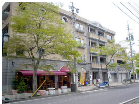
旧軽井沢三笠ハウス 外観