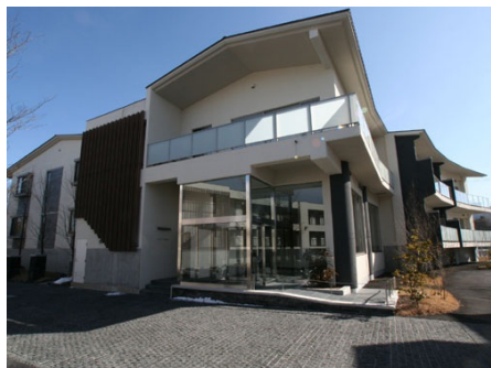
メビウスブレイン軽井沢 外観