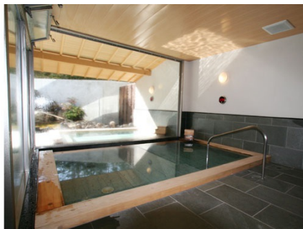
マンション内 大浴場