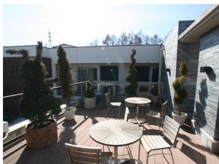
解放感溢れるビューラウンジ