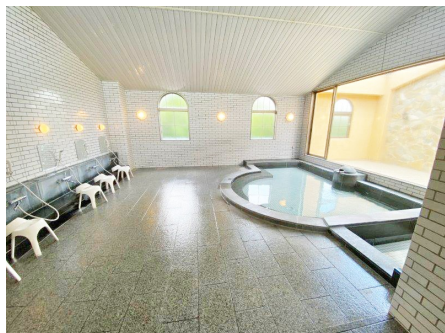
マンション内 大浴場