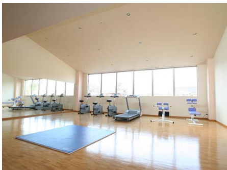
フィットネスルーム