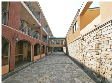
デュピア軽井沢 外観