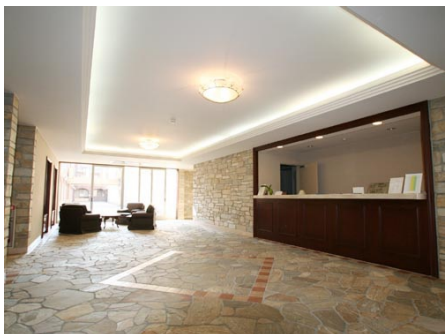
エントランスホール・フロント