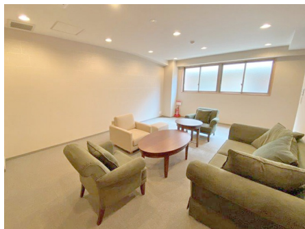
パーティールーム