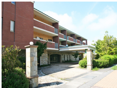
デュピア軽井沢 外観