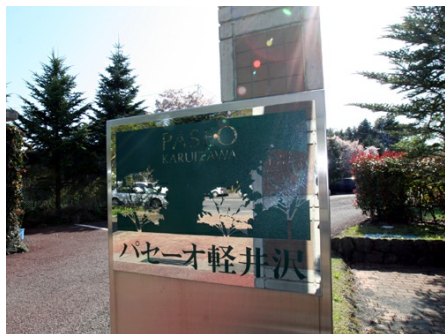
入り口のエンブレム