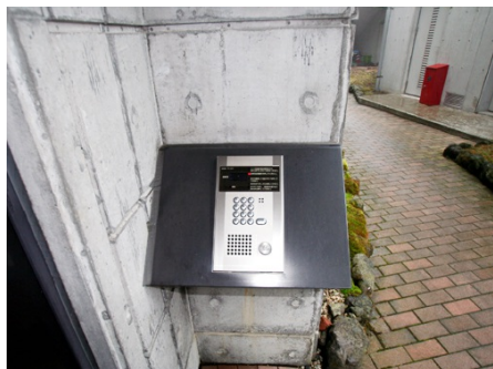
24時間オートロック