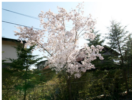
春には桜が楽しめます