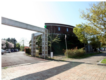
パセーオ軽井沢 外観