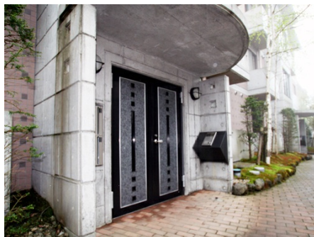
棟別のエントランス