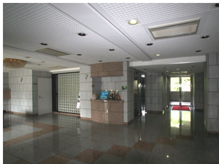
ロビーは石張りです