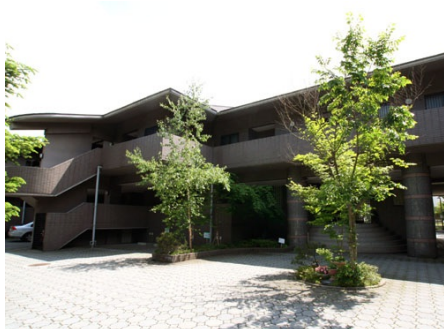
ライオンズガーデン 外観