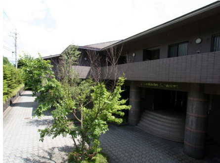
ライオンズガーデン 外観