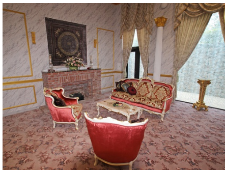
ゴージャスなラウンジ