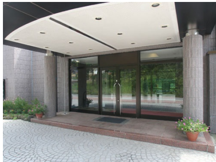
エントランス外観