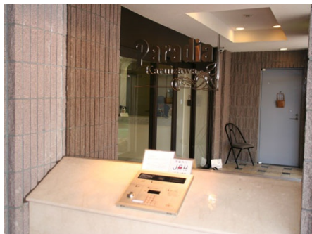
24時間オートロック