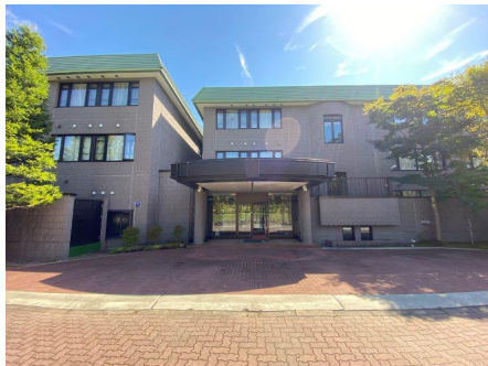
パラディア軽井沢外観