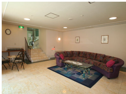
ゴージャスなロビー