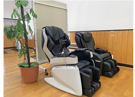
マッサージチェアでリラックス