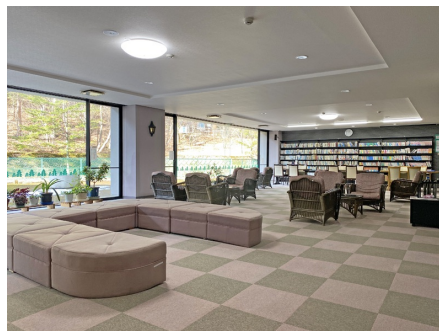
古書の貸し出しサービスも！