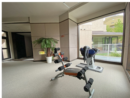
大浴場前の休憩コーナー