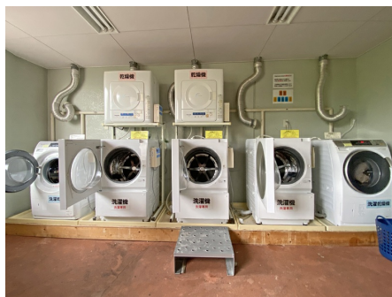
コインランドリー