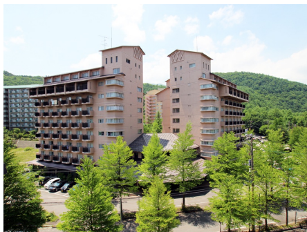
クアリゾート草津 外観