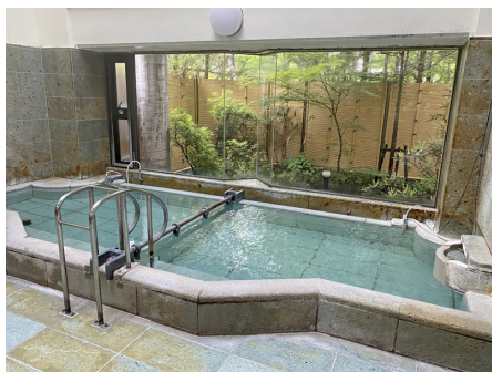
温泉大浴場はもちろん源泉かけ流し