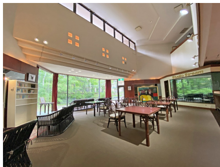
吹抜けで開放的なフリースペース