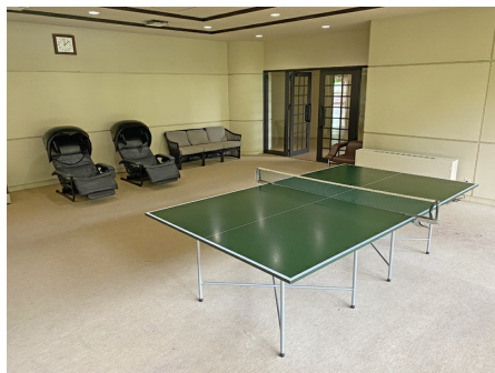
卓球台があります