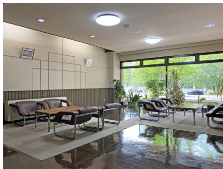
落ち着いた雰囲気ロビー