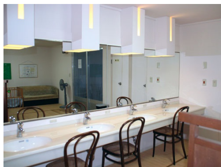
清潔感のある脱衣室