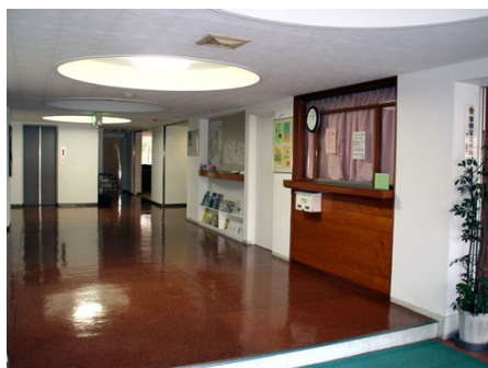
広々としたエントランス