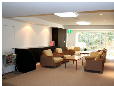
落ち着いたあるロビー