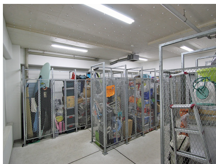
トランクスペース