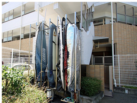
サーフボード置場