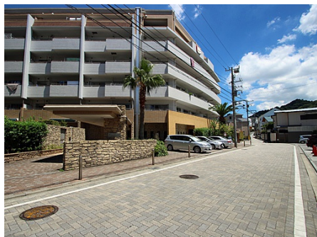
マンション前の通り