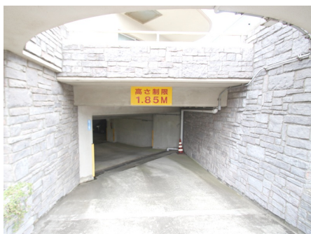
地下駐車場入り口