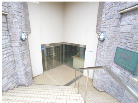
エントランスの階段とスロープ