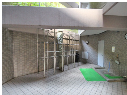
サーフボード置場