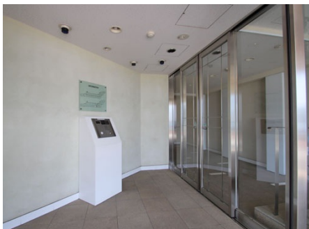
オートロック玄関