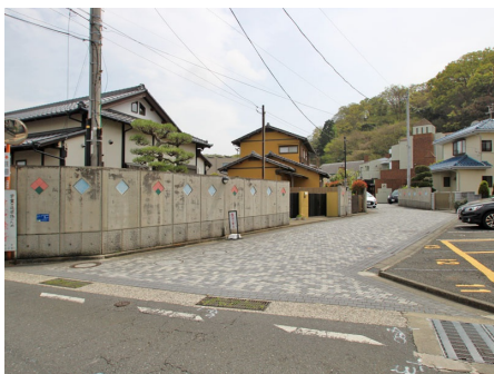
マンション出入口