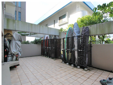
サーフボード置場