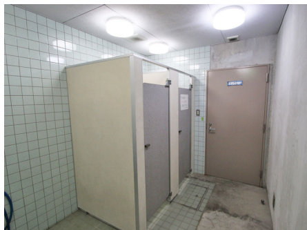
共用シャワールーム