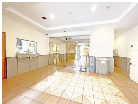
オートロック玄関