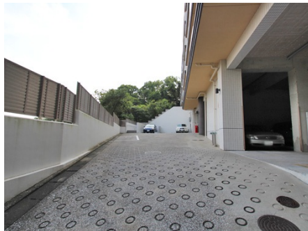
エントランスまでの通路