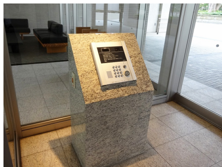
オートロック付き